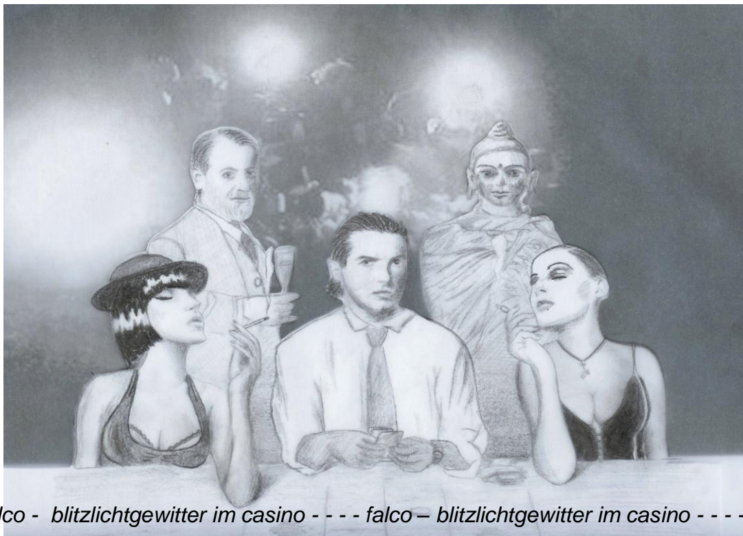
falco - blitzlichtgewitter im casino - - - falco – blitzlichtgewitter im casino - - - falco

1. Akt, Samstag, Wien, Spielcasino - Wir schreiben das Jahr 2009, eine heiße Sommernacht. Blitzlichtgewitter der Fotografen – Tumult - ich mittendrin – wie immer... Show-Biz... Musik im Hintergrund: ... Drum, wenn ich das große Los zieh und es geht nicht alles auf, mach ich in der nächsten Stadt mir doch glatt ein Spielcasino auf... „Geld“ – Geniales Lied – könnte glatt von mir sein... Und wer ist eigentlich die Kleine da hinten, die mir ständig zulächelt... „ Und man kann bekanntlich alles, auch die Liebe, dafür kaufen, doch der beste Weg von allen ist, es einfach zu versaufen...Geld... “ Während ich einen tiefen Schluck aus dem Whiskeyglas nehme, kommt ein Mann herein, ich weiß sofort, wer er ist. Verschlucke mich, muss husten. Was macht der hier – Im Jahr 2009? Populär, auch ein Superstar aus Vienna... Dr. Freud rockt durch den Raum, im Rhythmus zu MEINEM Song... „Geld, Geld, Geld...“. Blickkontakt auf die Ferne - Komme leider nicht durch die Menschenmasse – Statt dessen umgarnen mich die anderen, die mit ihm kamen. Die Gier, der Idealismus, und, wer ist die ältere Dame? Sie wirkt spießig! Da kommt die kleine Süße auf mich zu... Dr. Sigmund F. muss warten... das Girl und ich stoßen an... Der „Nachtflug“ kann beginnen... Spüre neidische Blicke in meinem Rücken. Was regen die sich auf - War doch eh von Anfang an klar - denn ich bin Falco.